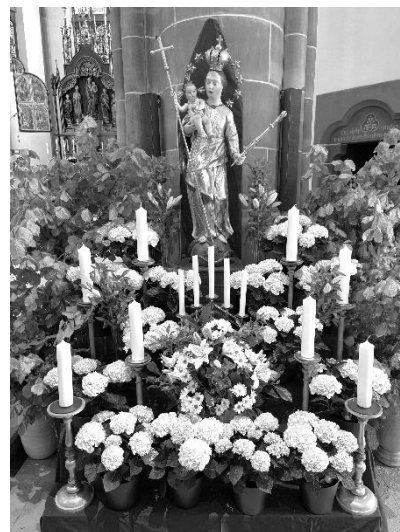
Maialtar der Stadtkirche Schönau, liebevoll gestaltet und durch viele Blumenspenden unterstützt