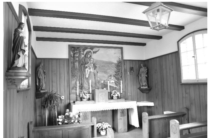
Innere der Muttergotteskapelle in Rollsbach mit dem Altarbild von Gerhard Bassler